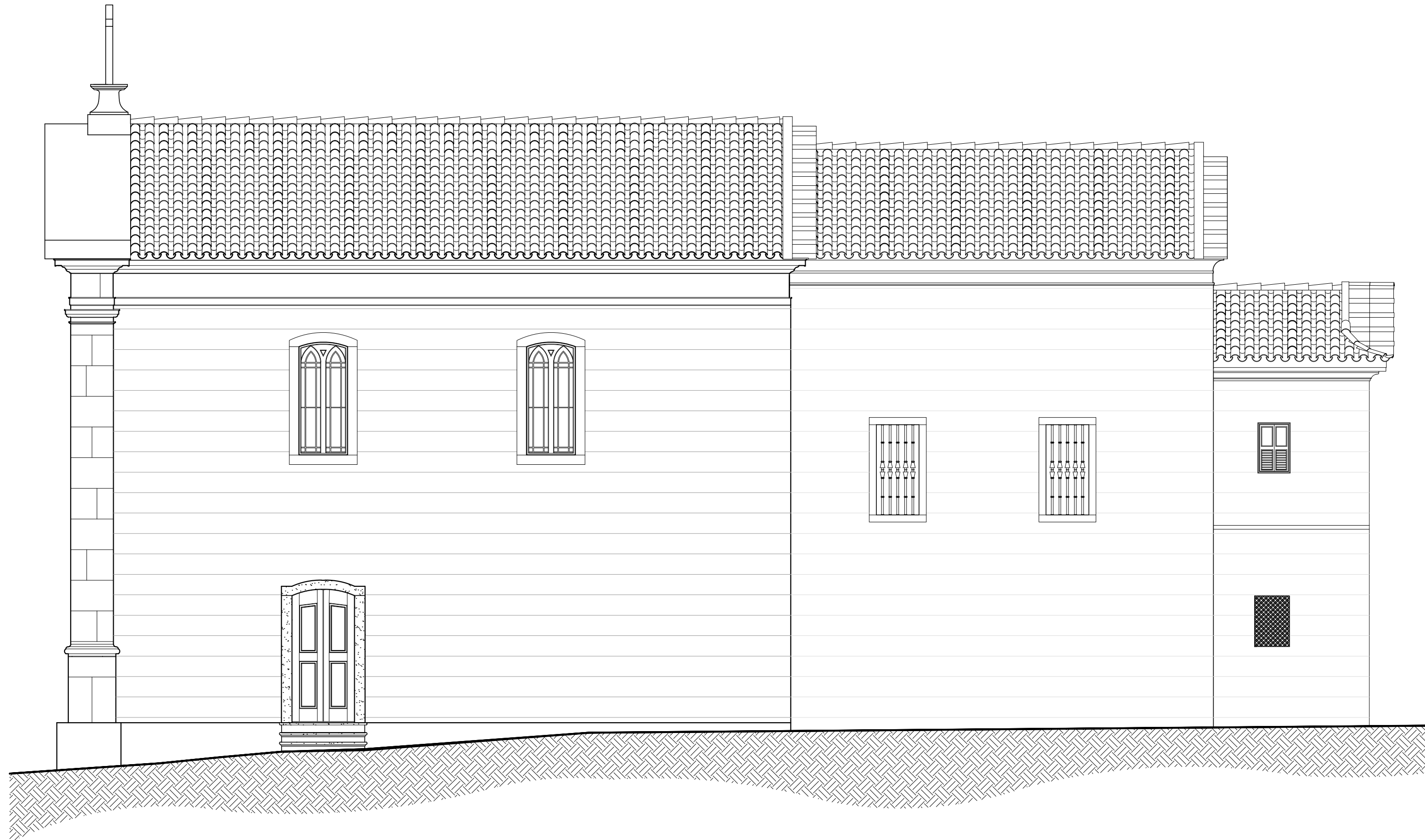
01 FACHADA LATERAL DIREITA ESCALA 1:75